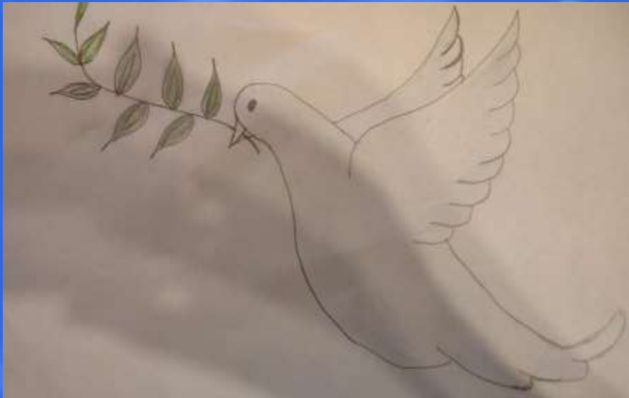
ПАНКОВ САША, 7 ЛЕТ