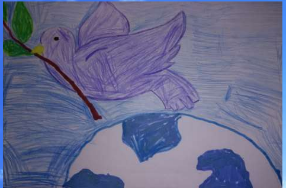
ЕСАУЯКОВ САША, 5 ЛЕТ